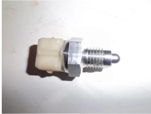
Vu du contacteur neuf

Le contacteur de référence 23 14 7 524 811 coute: 7,5€ chez BMW